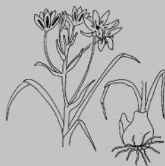
ORNITHOGALE (Ornithogalum umbellatum)

Enfin, la promenade se terminera par les Mûriers planes de l'avenue de la gare, le jardin Japonais et le minigolf au fleurissement toujours soigné. Evian cultive depuis toujours ces espaces de verdure dans le plus grand respect de l'environnement : ces qualités lui ont permis de décrocher en 2002 le Prix Européen du Fleurissement.